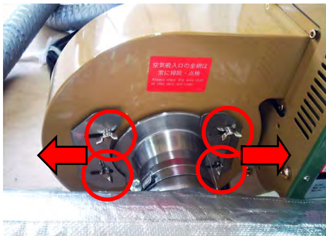
蝶ボルト4本を緩め、矢印方向に固定板をスライドさせます