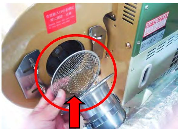
フィルタ(金網)を掃除し、元通りに取り付けます

※ 点検・清掃しないまま運転し続けると、熱セット性能低下・機械故障の主原因となります